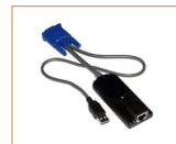
名称：数字KVM专用配套模块 型号：CM-1220U 接口类型：USB 线长：50米